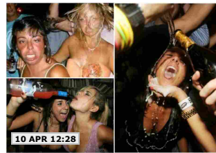
10 APR 12:28