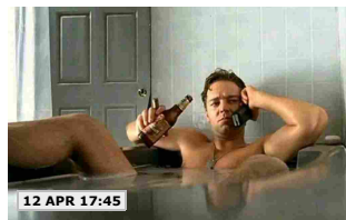
12 APR 17:45

I SEGRETI PICCANTI DEL "GLADIATORE" - RUSSELL CROWE DIMENTICA IL CELLULARE NELL'AUTO CHE VA ALL'ASTA: SUL TELEFONO SMS IMBARAZZANTI - ECCO COSA C'ERA SCRITTO: "STO..."