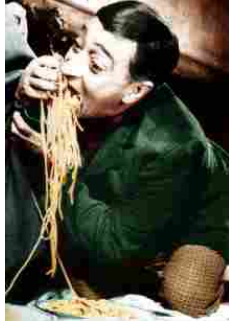
LA GRANDE ABBUFFATA 2

ferrovieri, per lo più sedentari e magari sovrappeso?