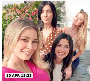
10 APR 15:23