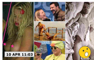
10 APR 11:03