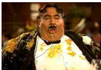
LA GRANDE ABBUFFATA

Strategia per accalappiare lettori, penseranno i più smaliziati. La nutrizionista,