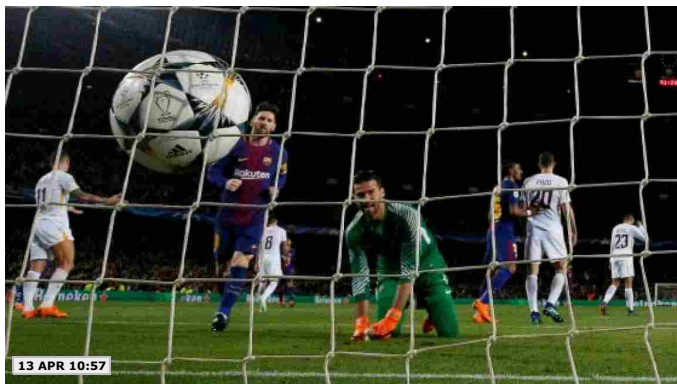
13 APR 10:57

MEDIASET HA FATTO GOL - PICCHI ASCOLTI PER REAL MADRID-JUVENTUS E ROMA-BARCELONA - ALDO GRASSO: "LA NUOVA STRATEGIA DEL "BISCIONE", SEGNATA DAL RITORNO FORTE DELLA TV GRATUITA FINANZIATA DALLA PUBBLICITÀ, SEMBRA DARE I SUOI FRUTTI - IL RECENTE ACCORDO SIGLATO CON SKY HA PERMESSO A MEDIASET DI USARE UN PRODOTTO TIPICAMENTE 'PREMIUM' COME IL CALCIO PER POTENZIARE LE SUE RETI GENERALISTE"